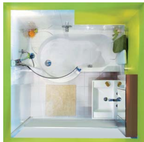
Bad, dusch och handfat på bara 160 x 160 cm !