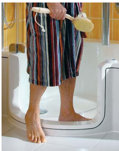
Möjlighet till extra lågt insteg, endast 7 cm, för ökad säkerhet och bekvämlighet. (med TwinLine nersänkt i golv)

Den funktionella designen och de olika storlekarna skapar nya möjligheter till ändamålsenliga badrum, även för de allra minsta.